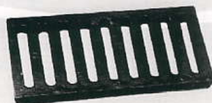
Sl.24.Linijska rešetka (bez okvira)