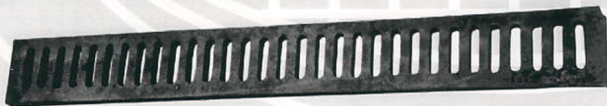
Sl.24.Linijska rešetka (bez okvira)