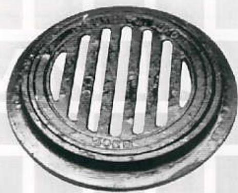
SI.10. Okrugla kanalska rešetka