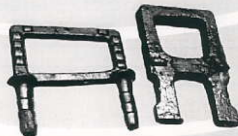
SI.13. Penjalica (stupaljka) za reviziono okno